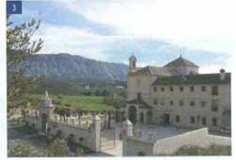
1. Campas, Carmona (Sevilla). 2. Trabajos verticales Sirio Multiservicios. Central de gas ciclo combinado de Astom. 3. Fachada Hotel La Magdalena.