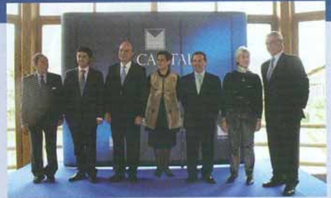
IX Premio de Cultura M Capital.

En el ámbito formativo, además de ciclos de seminarios y conferencias, la entidad hace entrega cada año del 'Premio Emprendedores M Capital. Ideas y Personas para el Centro de Andalucía'. Su objetivo